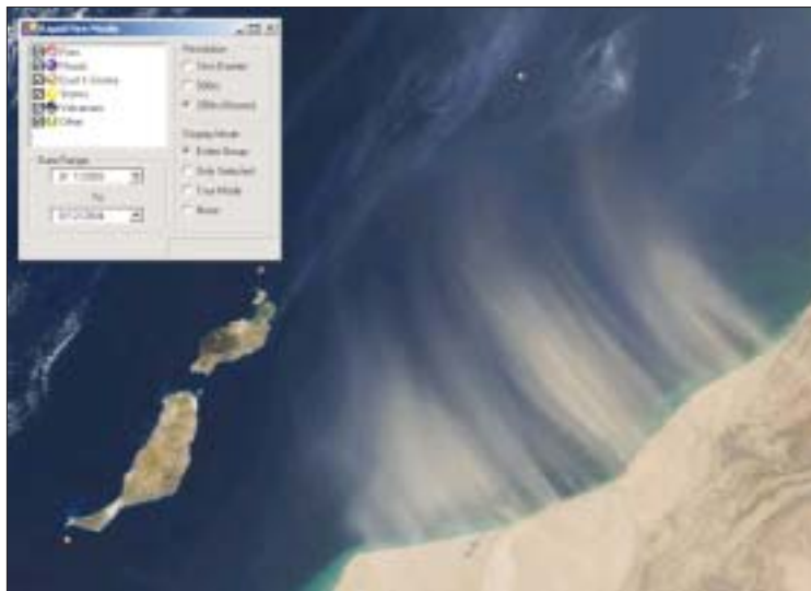
METEOROLOGIA. La Calima vista desde el satélite en World Wind

Para obtener más información: -http://worldwind.arc.nasa.gov- -http://earth.google.com-