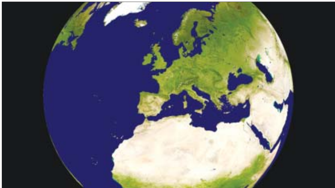
ANIMACION. World Wind permite ver animaciones de distintos fenómenos meteorológicos.

World Wind le permitirá vivir una experiencia inigualable en la que podrá descargar en su ordenador información proporcionada por distintos satélites, visualizar nuestro planeta en tres dimensiones, utilizar imágenes meteorológicas de radar, obtener información geográfica, mapas, enlaces a la Web con información de distintos puntos de interés... En definitiva, puede tener el mundo entero a su alcance. Entre otras cosas,