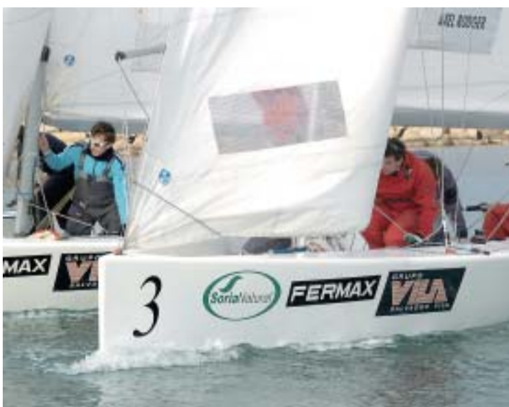
▲ EN EL CAMINO. Rodger tampoco tuvo su mejor día.

■ Para que el Club Náutico de Xàbia pudiera vestir el estreno de esta regata nacional de prestigio, el Comité Organizativo de Regatas quiso usar la marca de prestigio que el club tiene desde 1976. Thomas Lipton, uno de los desafiantes históricos de la Copa del América con cinco participaciones, cedió una réplica de su barco como trofeo con la única condición de que esta valiosa pieza nunca abandonara las instalaciones del club y que fuera repartido entre los futuros ganadores.