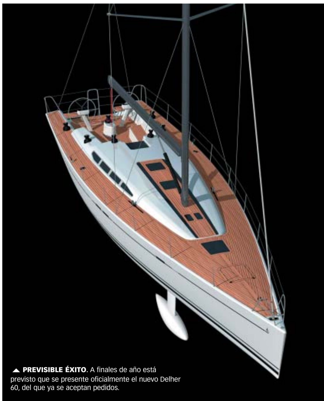
▲ PREVISIBLE ÉXITO. A finales de año está previsto que se presente oficialmente el nuevo Dehler 60, del que ya se aceptan pedidos.

La nueva estrella del astillero alemán ha sido diseñado por Simonis/Voogd y sigue la misma estela exitosa del Dehler 44, del que en pocos meses se han vendido más de 30 unidades.