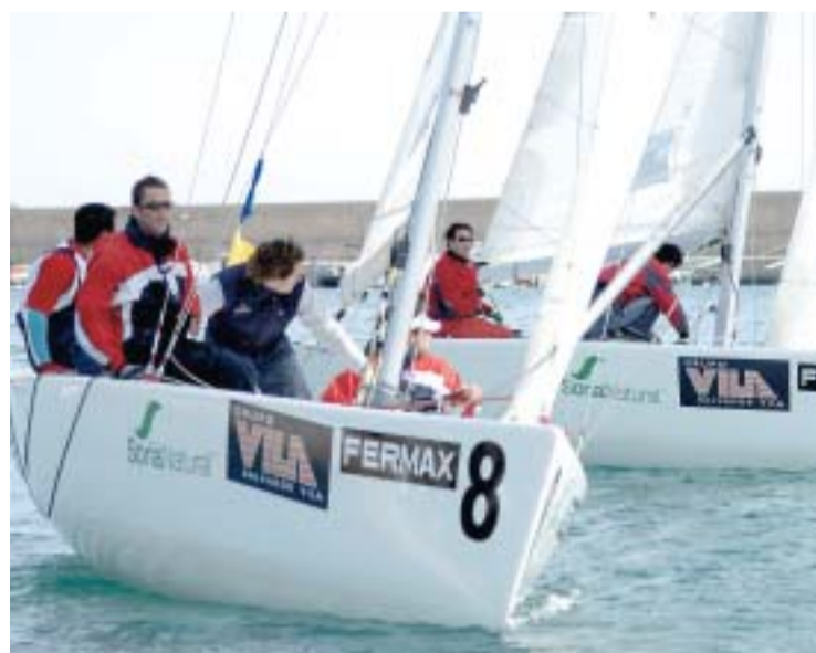
▲ CERCA. Los barcos regateaban cerca de los aficionados.

clasificación a la final. No obstante, el equipo de Maestre que representa al Club Náutico de Xàbia, consiguió acaparar los ánimos de todos los aficionados que se acercaron a la playa para seguir el evento. La regata de Xàbia ha conseguido