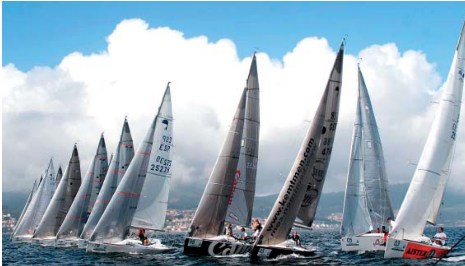
▲ EN CRECIMIENTO. Imagen de archivo del Mundial de Platú 25, en el que participó «Canon».