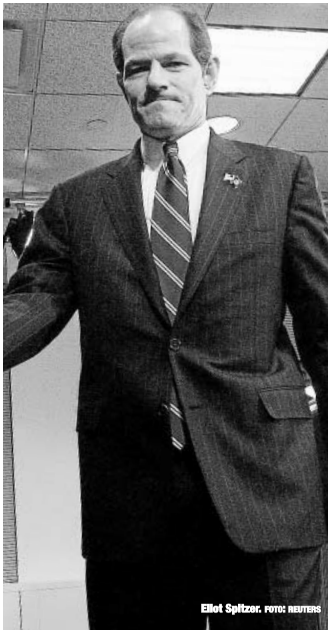
Eliot Spitzer.

¿Se puede odiar la prostitución (o la novela) sin ser al mismo tiempo esclavo de ella? Resulta dudoso. Mucha gente achaca mi anticlericalismo a la sospecha de que en el fondo me gustaría ser obispo. No lo niego. Me vuelven loco los palacios episcopales, cuyo disfrute, con la nueva lista de pescados capitales, quizá tenga los días contados. Me fascina la tranquilidad y el orden que se respira en ellos. La atmósfera de recogimiento de estos lugares resulta ideal para la creación. Y tienen ama de llaves, chofer, quizá mayordomo. ¡Y claustro, Dios mío, tienen claustro! Si yo viviera en un palacio episcopal sacaría dos novelas al año sin exagerar; exagerando, cuatro o cinco. Y no