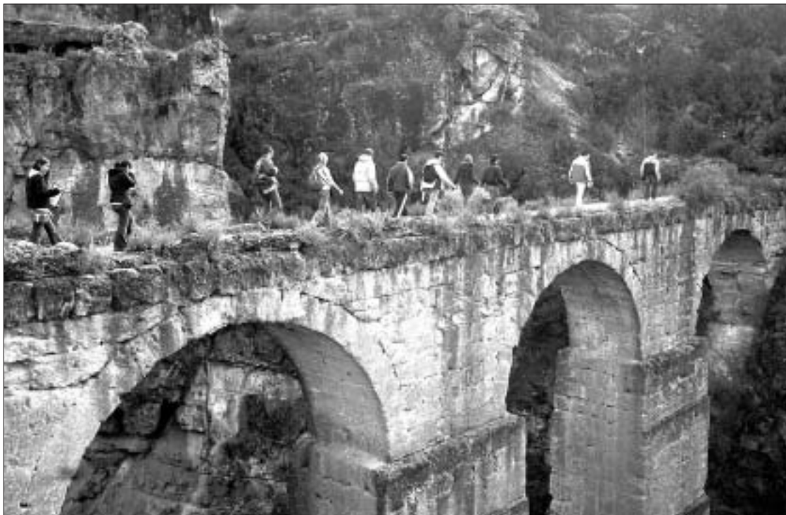
JOSÉ M a AZKÁRRAGA

El que més cridà l'atenció va ser l'actuació dels professors d'Àustria i Bèlgica, que presentaren el seu treball abillats amb túniques romanes tot aconseguint la participació dels alumnes a partir d'un